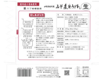
(商品パッケージ裏)