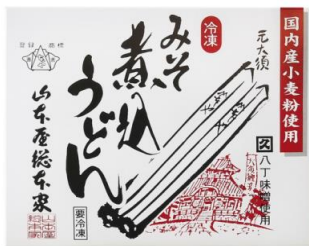
(商品パッケージ表)